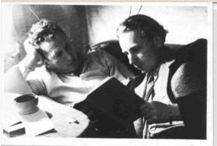
Londyn, maj 45 roku.